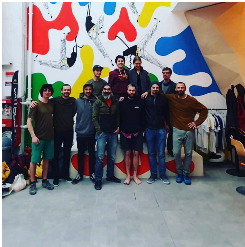
Participanți la cursul de formare și perfecționare Amenajatori de trasee de escaladă