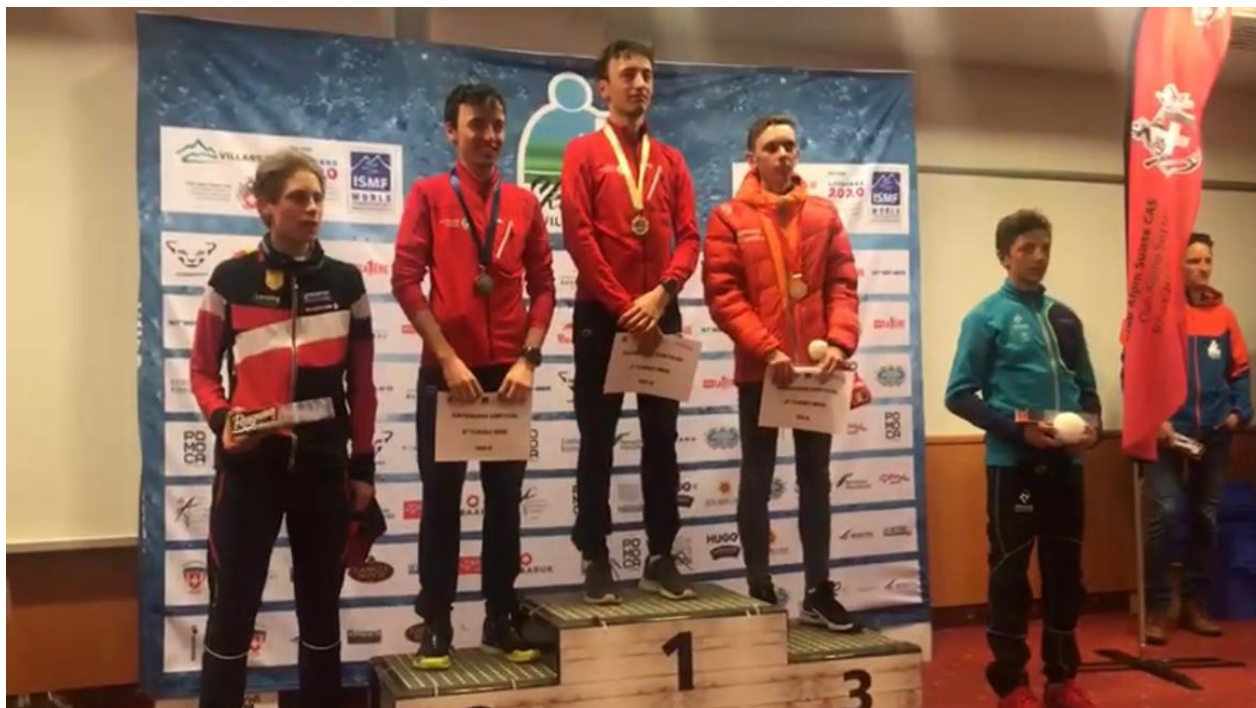
Locul 3 la Campionatul Mondial 2019