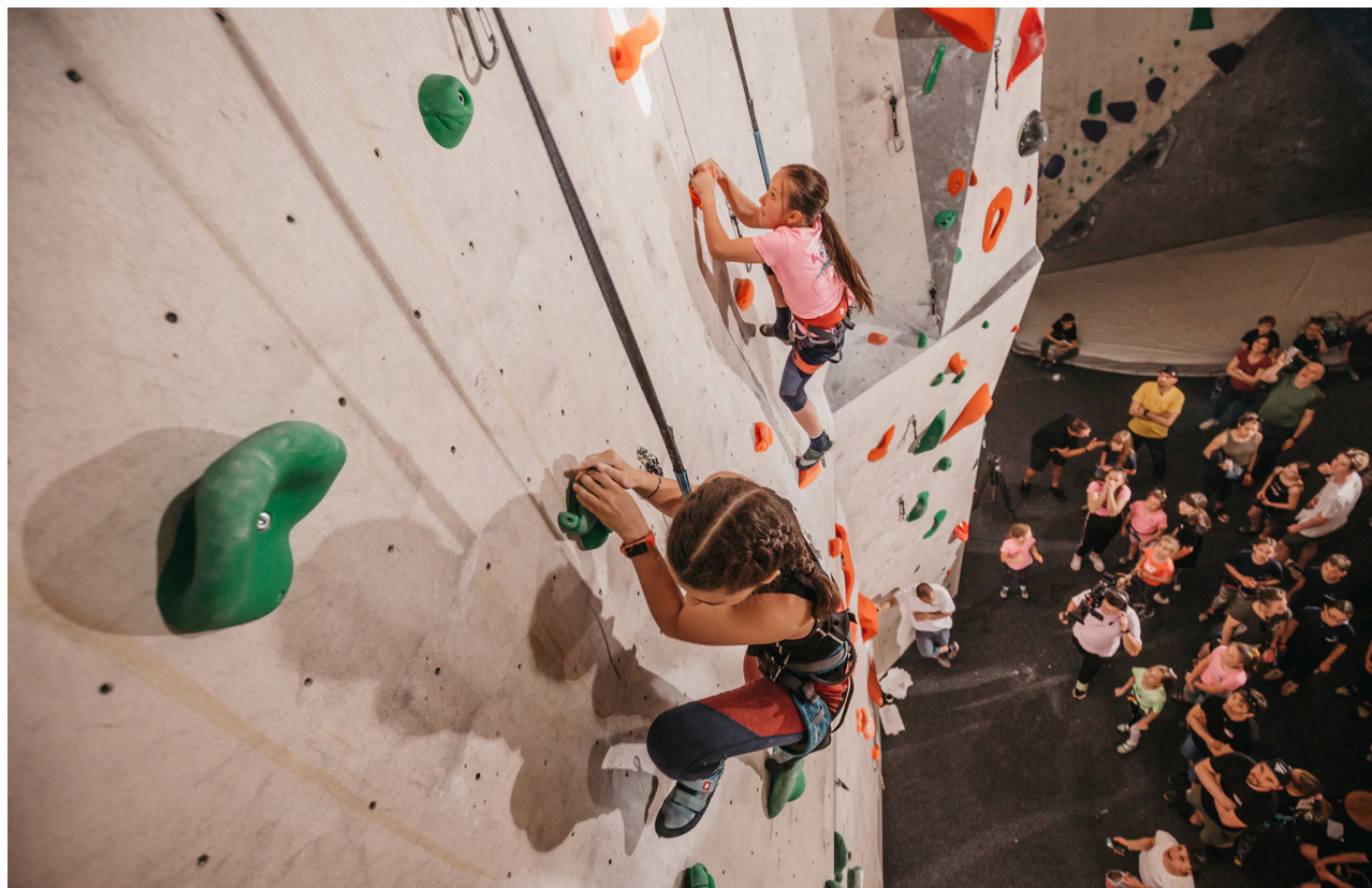
Proba de escaladă viteză la copii– Campionatul Național de Copii și juniori 2022, Cluj Napoca