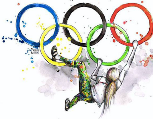
Escalada sportivă la Jocurile Olimpice din 2020 – Tokyo

După o perioadă lungă de tratative, escalada sportivă a obținut un loc la Jocurile Olimpice din 2020 la Tokyo (Japonia), cu un format reactualizat/schimbat, care va avea trei discipline, Lead, Bouldering și Speed cu 20 de sportivi la start atât la băieți cât și al fete. Forma finală cât și metodologia exactă încă nu este clarificată în întregime.