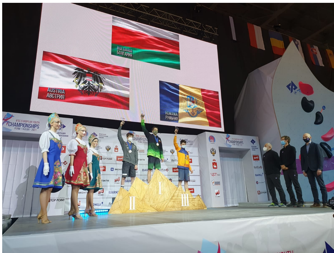
Medalia de Bronz pentru Darius Râpă la Campionatele Europene 2021 din Perm, Rusia