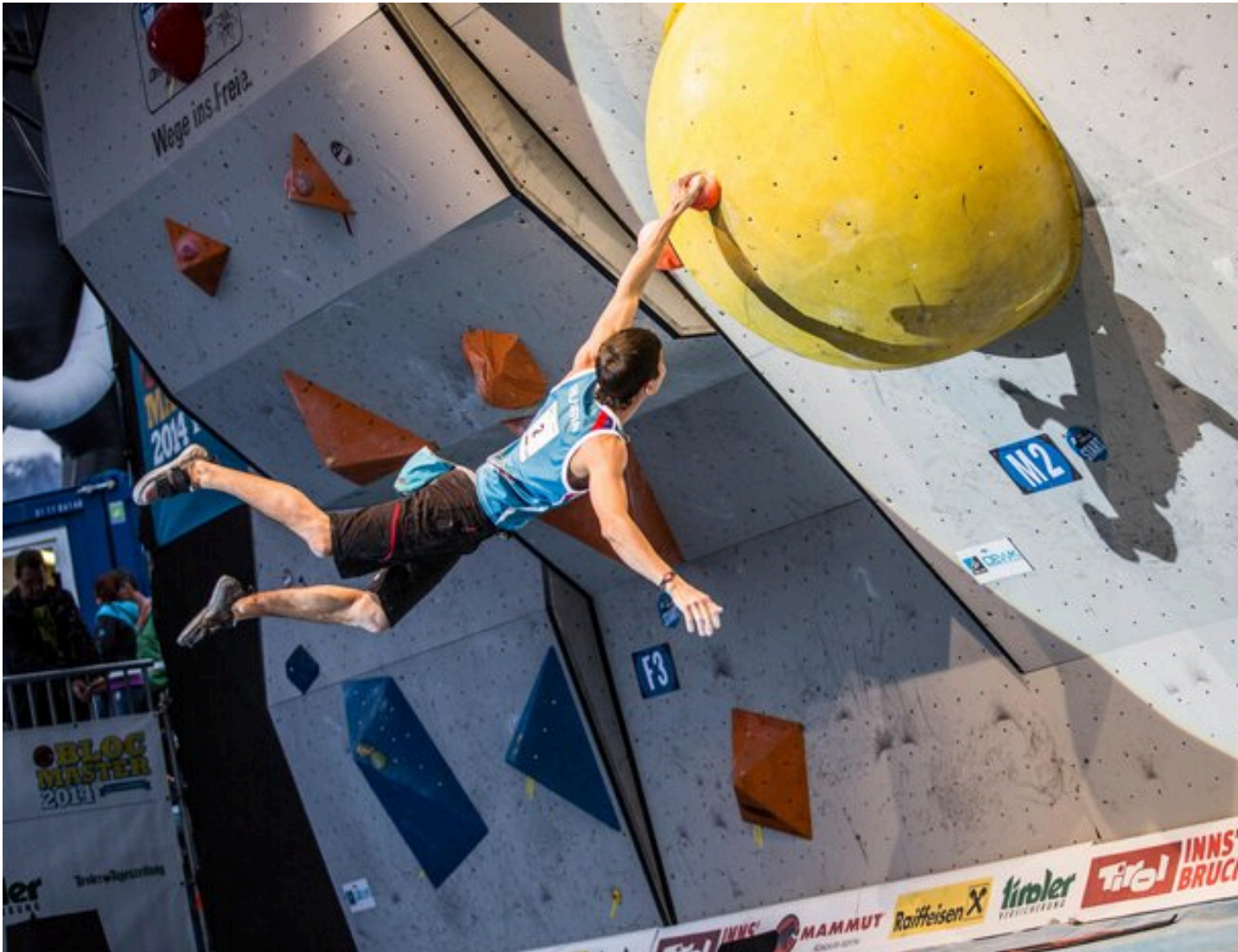
Escaladă Bloc (Bouldering) la Cupa Mondială