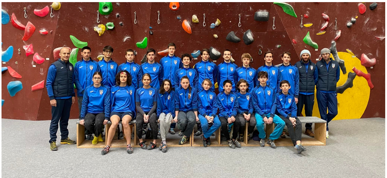
Echipa Națională de Escaladă sportivă - Tineret și Juniori al României

F.R.A.E. funcționează în baza Statutului său, elaborat în conformitate cu prevederile legale și cu statutul Federației Internaționale de Alpinism și Escaladă.