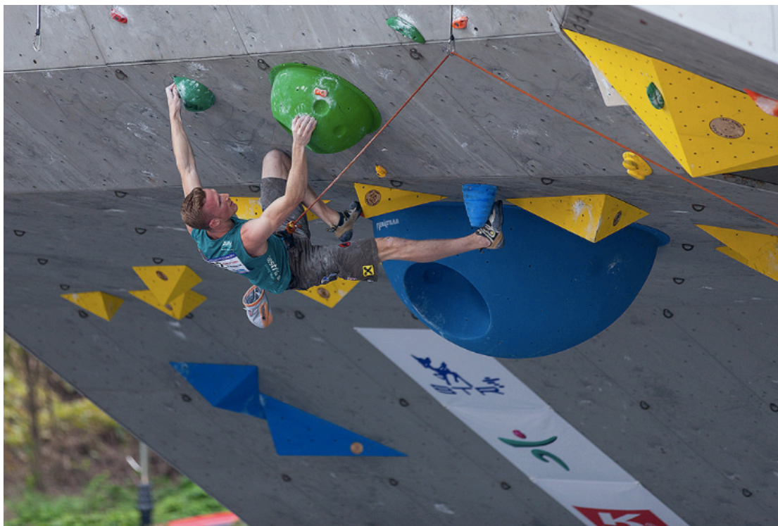
Escaladă dificultate (Lead Climbing) la Cupa Mondială